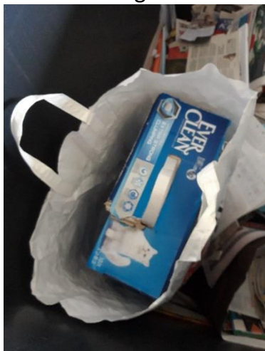
Kartong är inte tidningar

Här är det någon som vet att de har gjort fel och har tagit bort sitt namn.